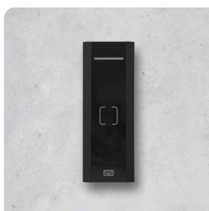
2N® ACCESS UNIT M RFID MULTIFREQUENCY, NFC 916114