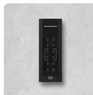
2N® ACCESS UNIT M TOUCH KEYPAD & RFID, NFC 916116