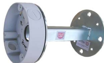
HIK170N + J-BOX01HK

montážne otvory Ø5mm umožňujú inštaláciu týchto päťíc Hikvision : DS-1260ZJ, J-BOX01HK, DS-1280ZJ-S a DS-1280ZJ-DM18