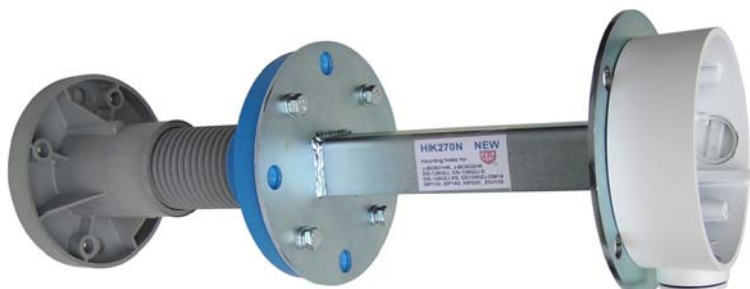
ISP200 + HIK270N + DS-1260ZJ

montážne otvory Ø5mm umožňujú inštaláciu týchto päťíc Hikvision : DS-1260ZJ, J-BOX01HK, DS-1280ZJ-S a DS-1280ZJ-DM18